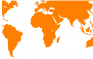
Gran participación en programas intercultural