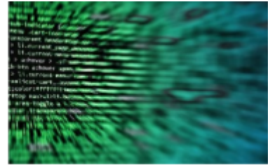
Revisa las profesiones con mayor inserción laboral