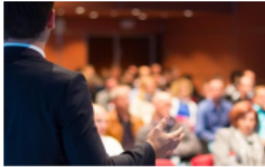
Éxito de asistencia a la IV Jornada Formativa de SYMPOSIUM